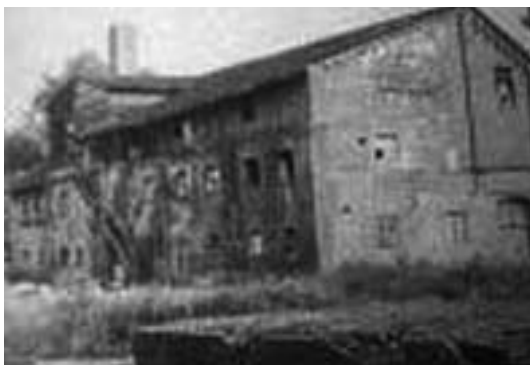
Ellrich : les blocks 1 et 2