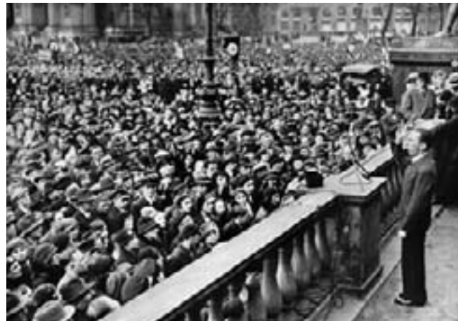
10 novembre 1938

... En moins de trois semaines, les Juifs raflés au cours de cette opération comptèrent plusieurs centaines de mort... Puis la plus grande partie des Juifs fut soudainement libérée, pour des raisons impénétrables que seules connaissaient les hautes autorités du Reich. On les conduisit mêmes aux frontières ou sur des navires d'émigration !... La notification des mises en liberté était faite par haut-parleur : “Baraques 1 à 5... Attention ! Les Juifs dont les noms suivent doivent se rendre immédiatement à la grande porte avec leurs effets.” Cet appel retentissait jour et nuit... On ne libérait que ceux qui pouvaient payer leur voyage. A cette fin, on créa une “caisse de voyage”. Elle se trouvait dans une valise bleue et devait être remise chaque soir au chef de camp Rödl et à l'inspecteur du camp Srippe... Le journaliste viennois, Gustav Herzog, écrit à ce sujet : “Bien que j'ai remis chaque soir contre reçu les sommes qui s'élevaient à plusieurs dizaines de milliers de marks,