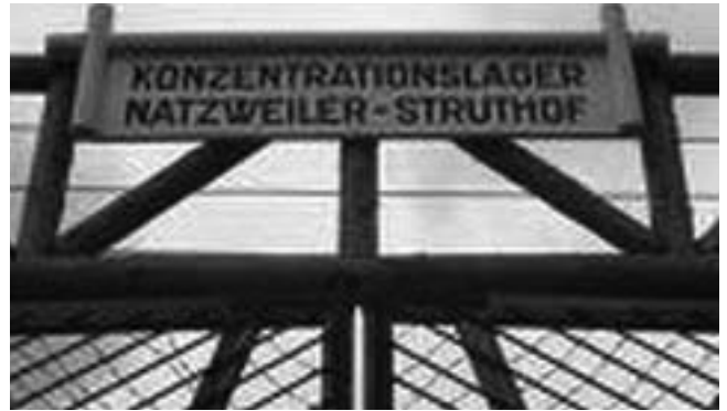
Porte d'entrée du Struthof