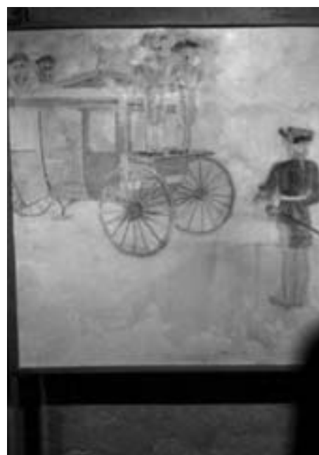
Une partie de la fresque d'Ellrich «Cendrillon»