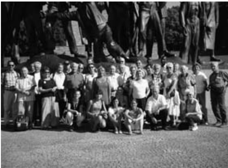
Le groupe à Buchenwald en août 2009

Prix par personne (tout compris) : en chambre double : 550 euros en chambre individuelle : 610 euros