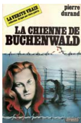
La Chienne de Buchenwald Prix : 10,50 euros (14 euros port compris)