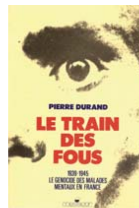
Le Train des Fous Prix : 14,50 euros (18 euros port compris)