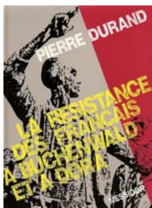
Les Français à Buchenwald et à Dora Prix : 21.50 euros (25,50 euros port compris)

Ses livres sont disponibles à notre association.