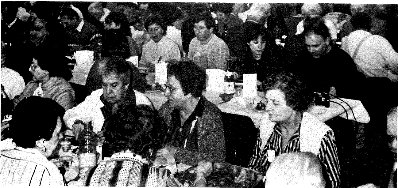
C'était en février dernier. Malgré le froid, ils étaient venus des quatre coins de la France, les cinq cents participants à notre grand repas où se retrouvent les anciens déportés de nos camps. Un rendez-vous annuel auquel beaucoup ne manquent jamais.

Je joins un chèque postal ou bancaire de _____ F