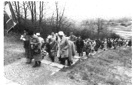
La lente montée, à Dora, au monument et au crématoire de l'un de nos pèlerinages.