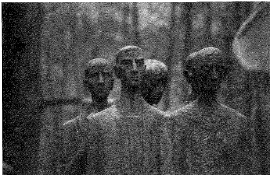
Les belles figures du monument qui, à Dora, rappellent ce que furent les souffrances, le calvaire des déportés utilisés dans les souterrains où étaient construits V1 et V2.