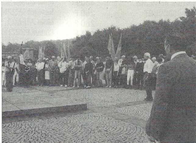
C'était en Août 1984. Notre pèlerinage, où les jeunes sont nombreux, au camp de Dora.

PS : Nos adhérents relèveront de sensibles augmentations de nos tarifs. Depuis deux ans, nous avons différé des mesures qui se révèlent malheureusement indispensables. Notre Association ne peut plus, notamment s'agissant des jeunes, continuer à assumer des charges financières très importantes. Mais croyez que nos prix sont toujours calculés au plus juste.